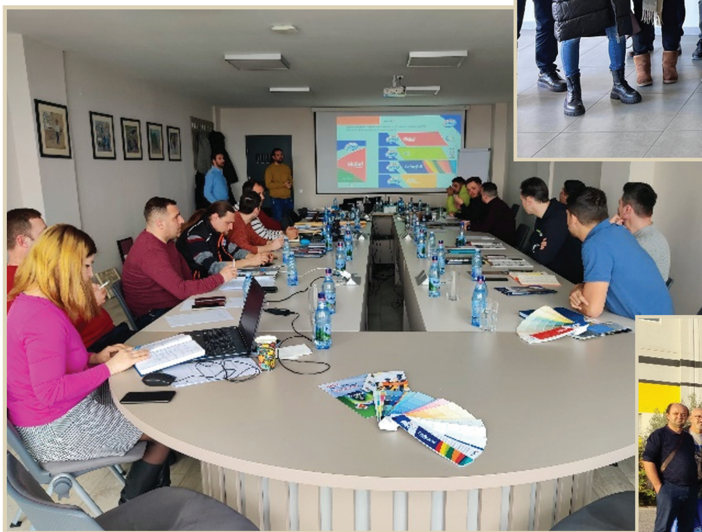
Τεχνικό Σεμινάριο, Ρουμανία