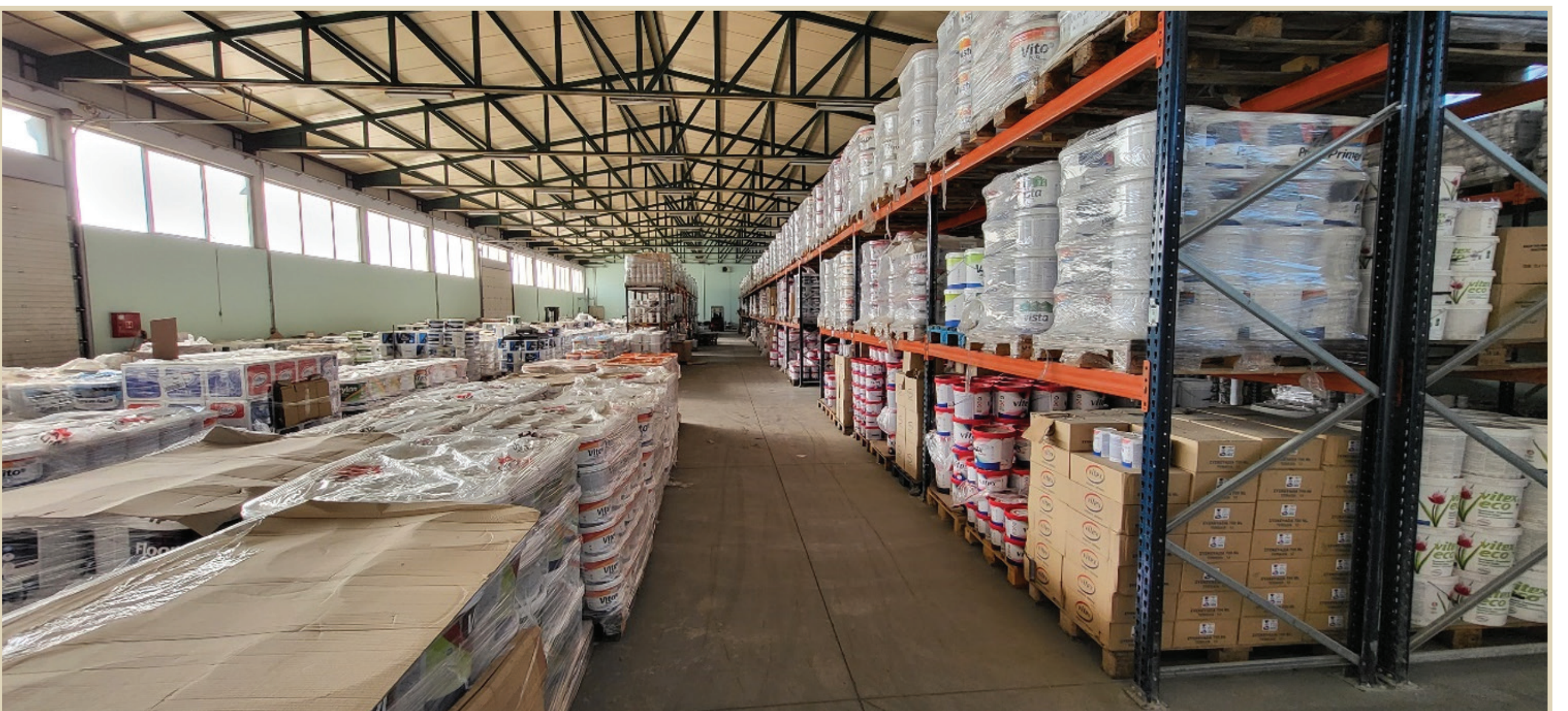
Αποθήκη Vitex Serbia, Σερβία - Συνολική έκταση 1.250m 2