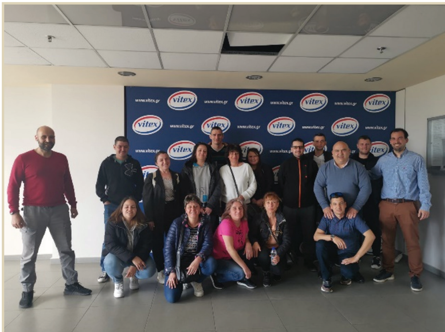
Σεμινάριο Mr. Bricolage Bulgaria στις εγκαταστάσεις μας

Στο πλαίσιο της συνεχούς εκπαίδευσης η Vitex εντάσσει τους ανθρώπους της που βρίσκονται στο εξωτερικό, αλλά και τους πελάτες της στα προγράμματα σεμιναρίων που διοργανώνει.