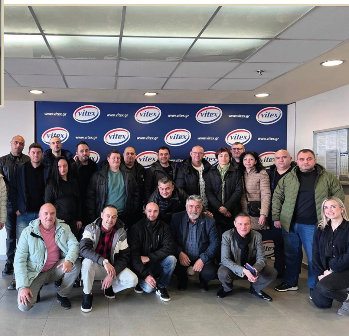
Σεμινάριο Praktiker Βουλγαρία στις εγκαταστάσεις μας

Στο πλαίσιο της συνεχούς εκπαίδευσης η Vitex εντάσσει τους ανθρώπους της που βρίσκονται στο εξωτερικό, αλλά και τους πελάτες της στα προγράμματα σεμιναρίων που διοργανώνει.