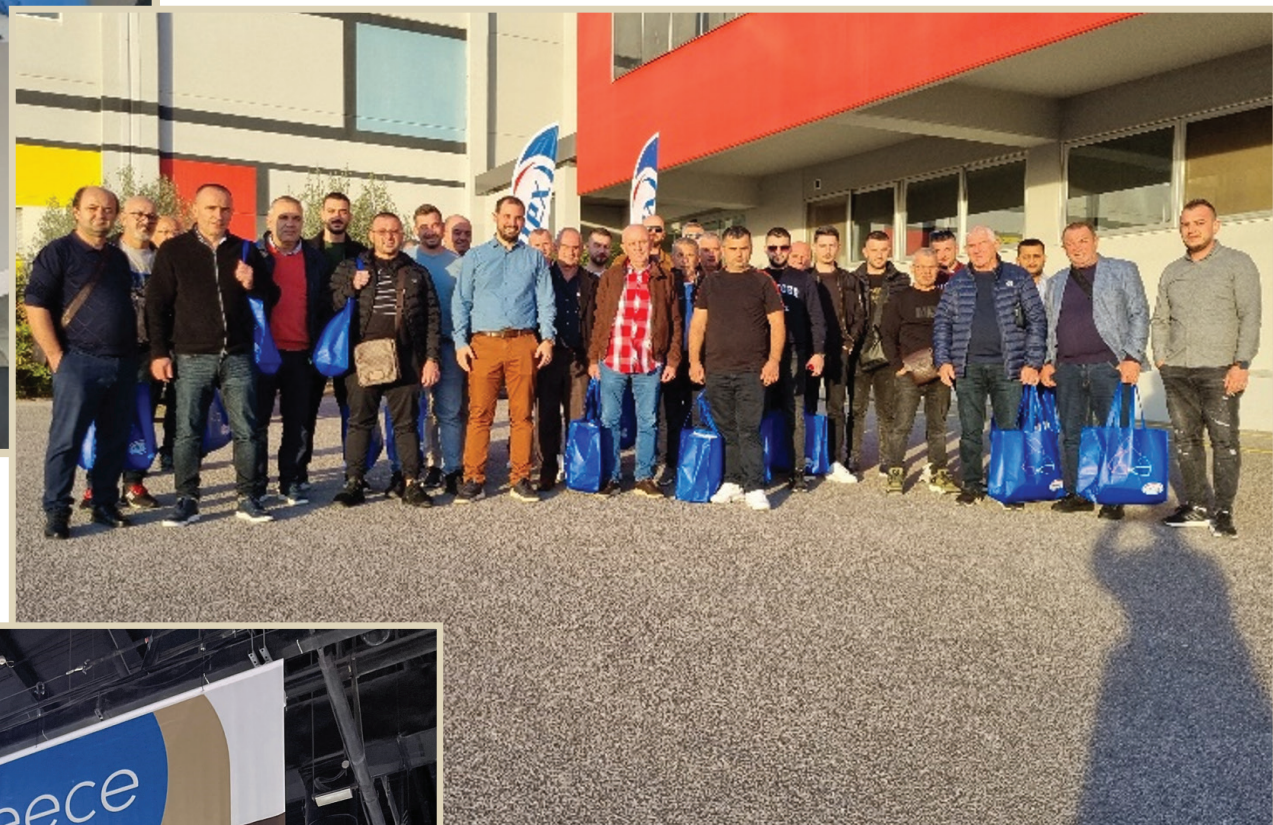
Σεμινάριο πελάτη μας από την Αλβανία στις εγκαταστάσεις μας

Στο πλαίσιο της εξωστρέφειας, της επέκτασης στις διεθνείς αγορές και στην αναζήτηση νέων συνεργασιών, η Vitex συμμετείχε για 6η χρονιά στην Διεθνή έκθεση BIG5 στο Dubai UAE.